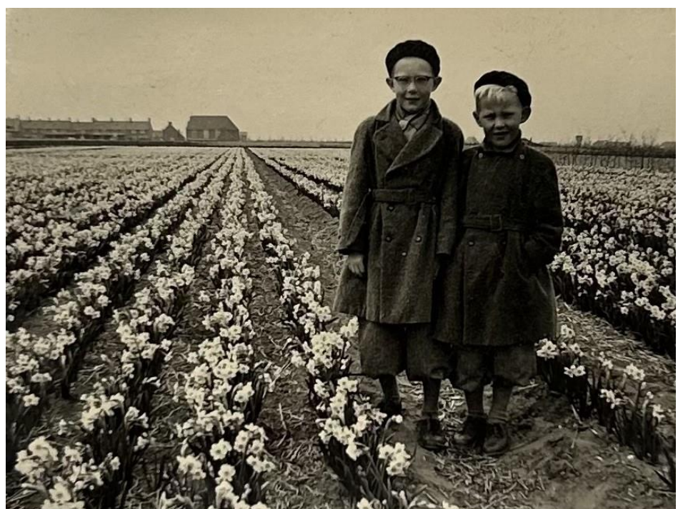
Foto: Eerste bloembollen (narcissen) ten zuiden van Ens in 1954. Op de achtergrond is de nieuwe Gereformeerde kerk zichtbaar.