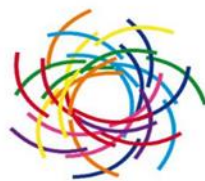
O.B.S. De Regenboog